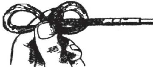
Рис. 137. Накладання ганчір'я на протирку

Просочити ганчір'я рідким рушничним мастилом, увести шомпол із протиркою і ганчір'я в канал ствола і застопорити кришку пенала на дуловому зрізі ствола. Утримуючи автомат лівою рукою, плавно просунути правою рукою шомпол по всій довжині каналу ствола кілька разів. Витягнути шомпол, змінити ганчір'я, просочити його рідким рушничним мастилом і знову прочистити канал ствола. Так зробити кілька разів. Після цього ретельно витерти шомпол і протерти канал ствола чистою сухою ганчіркою. Оглянути ганчірку. Якщо на ній помітні сліди нагару або забруднення, продовжувати чищення каналу ствола доти, поки після перевірки ганчірка не буде чистою. Ретельно оглянути канал ствола на світло з дулової частини і з боку патронника, повільно обертаючи ствол у руках. При цьому особливу увагу звертати на кути нарізів, перевіряти, чи не залишилось у них нагару. У такій самий спосіб вичистити патронник з боку ствольної коробки.