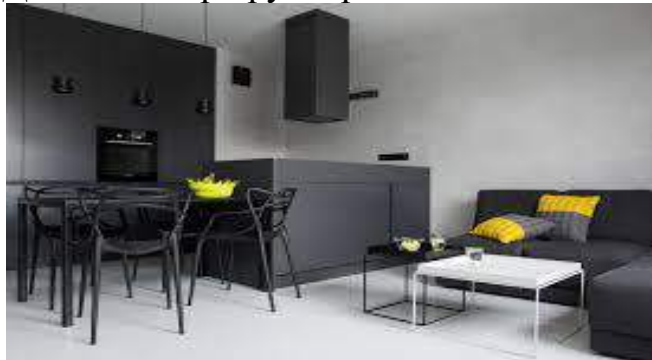
Дизайн інтер'єру:Ахроматичний стиль